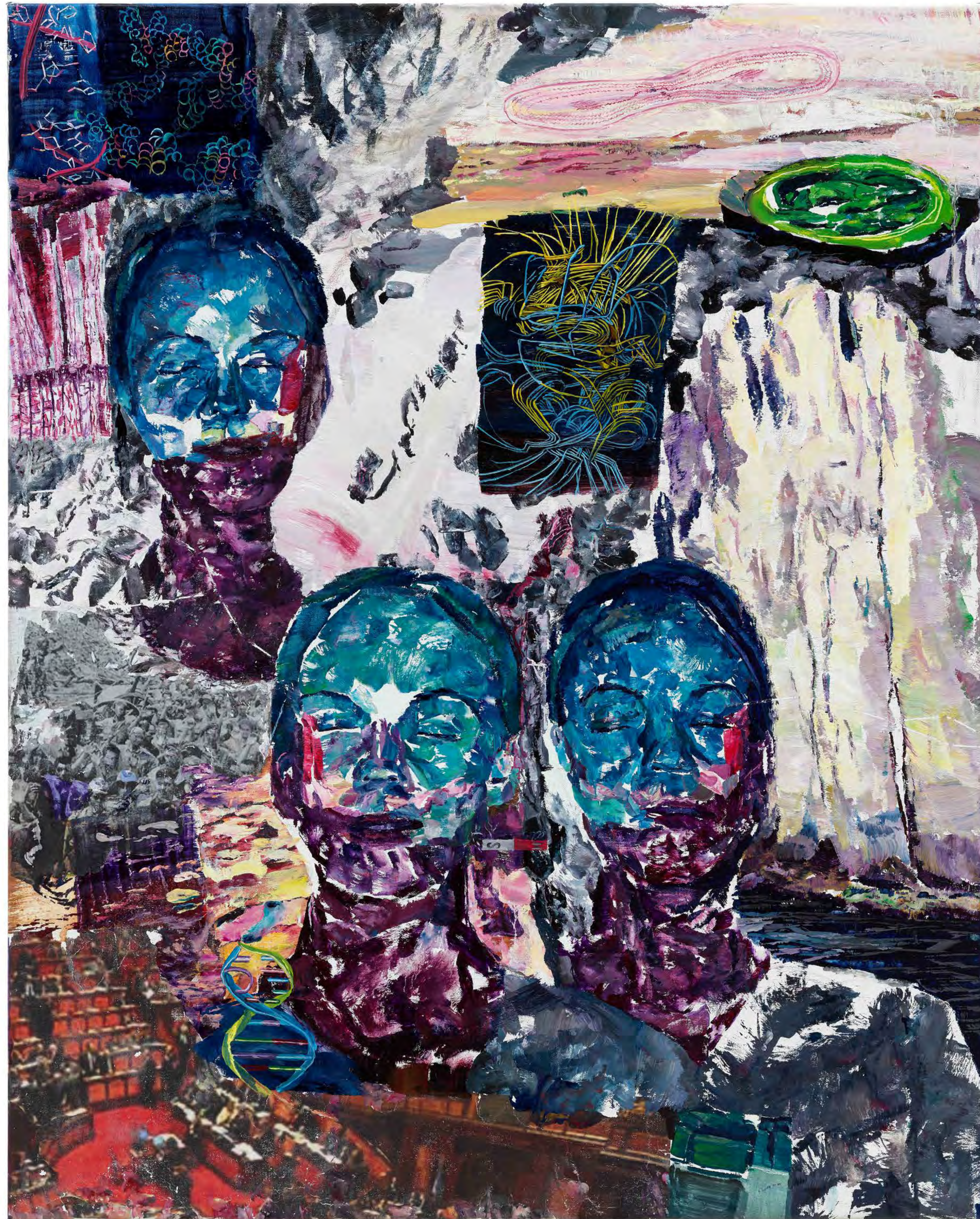
Marie-Curie zeigt (drei Mal) den Nordpol. 2022 oil on canvas and emulsion 96 x 76 cm / 37,8 x 29,92 in.