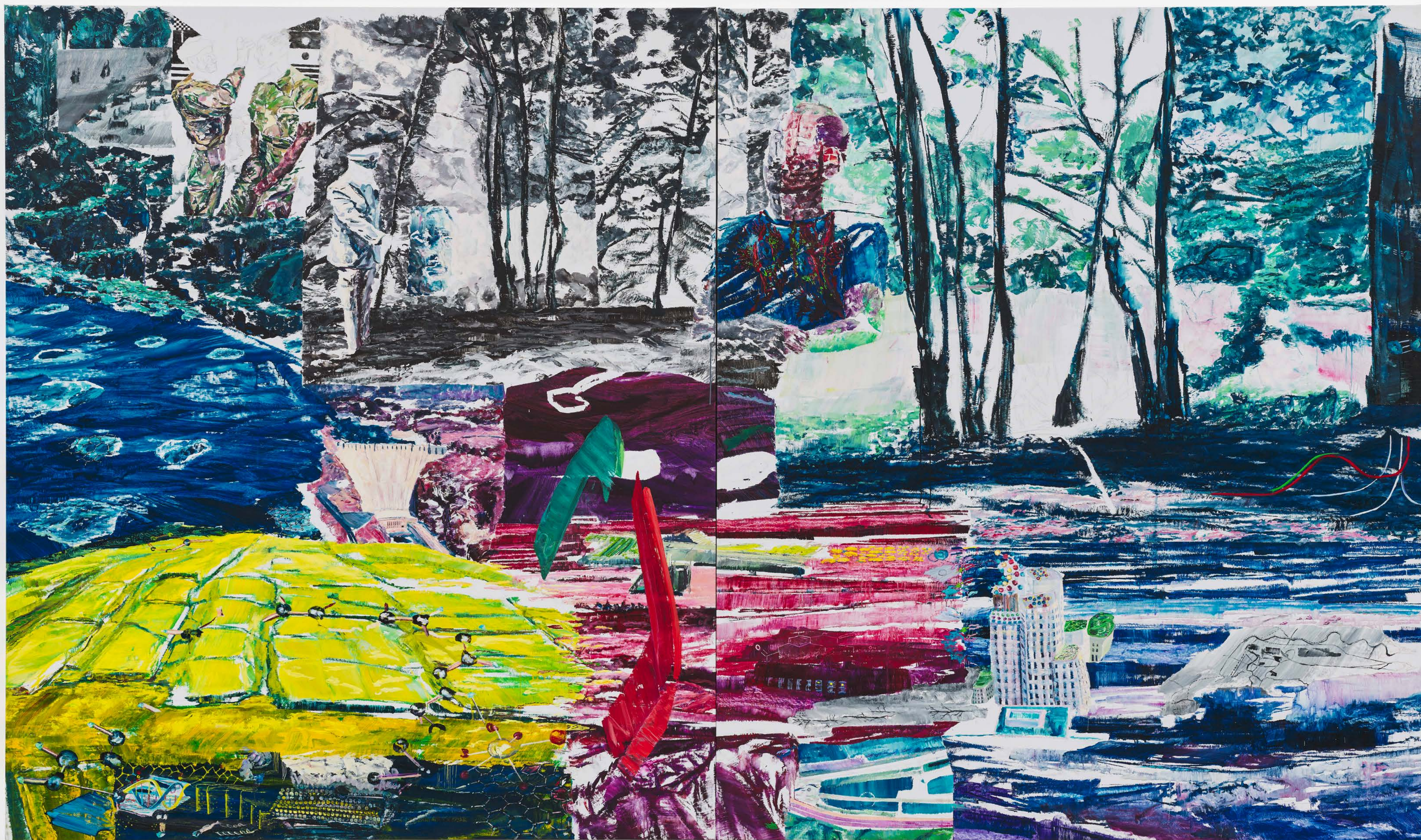
Die Begegnung in Pnyx, 2022-23 oil on canvas 200 x 340 cm / 78,74 x 133,86 in. (Diptych)