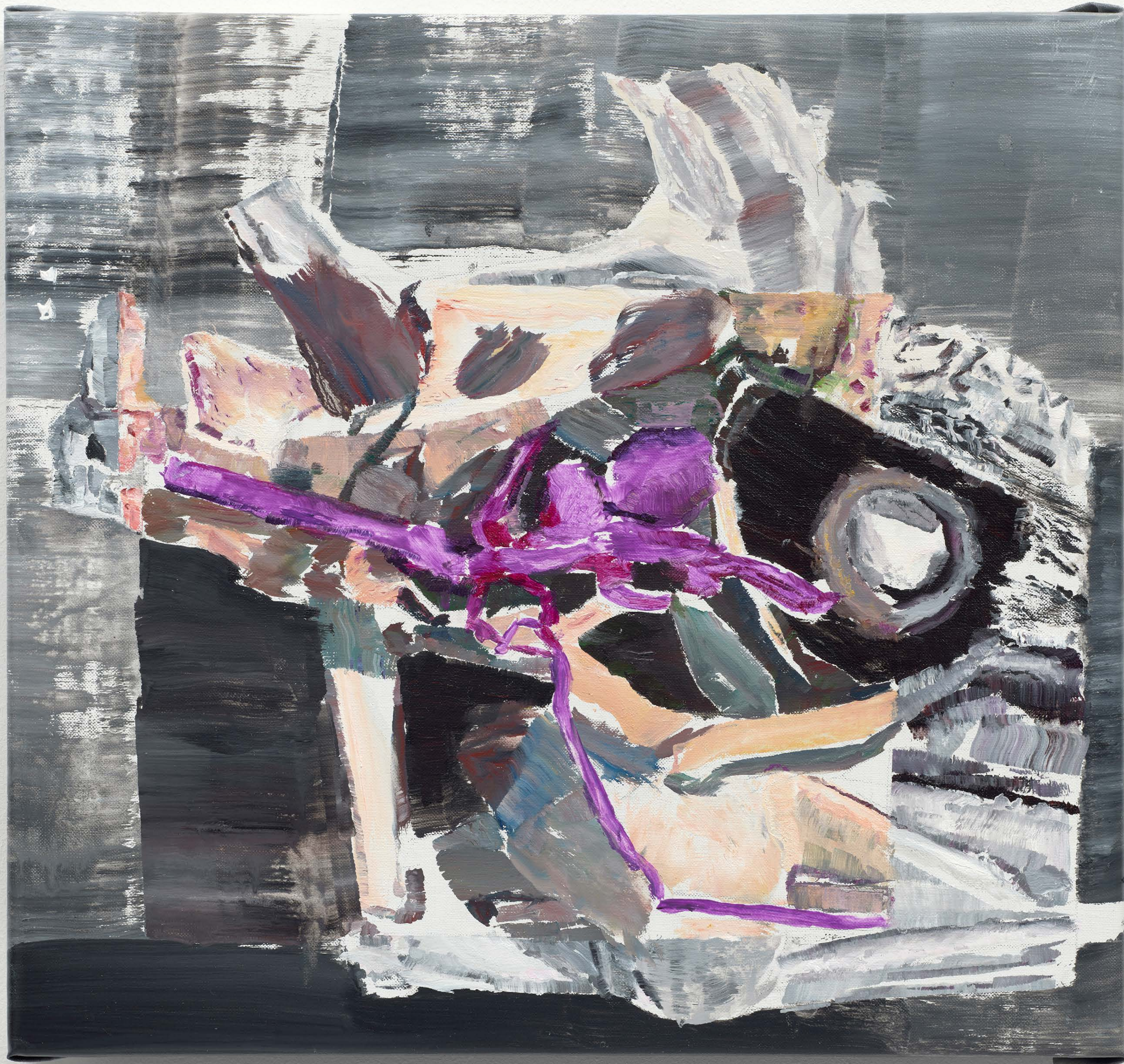
Um herum, 2026 oil on canvas 40 x 43 cm / 15,75 x 16,93 in. EUR 4.000,-