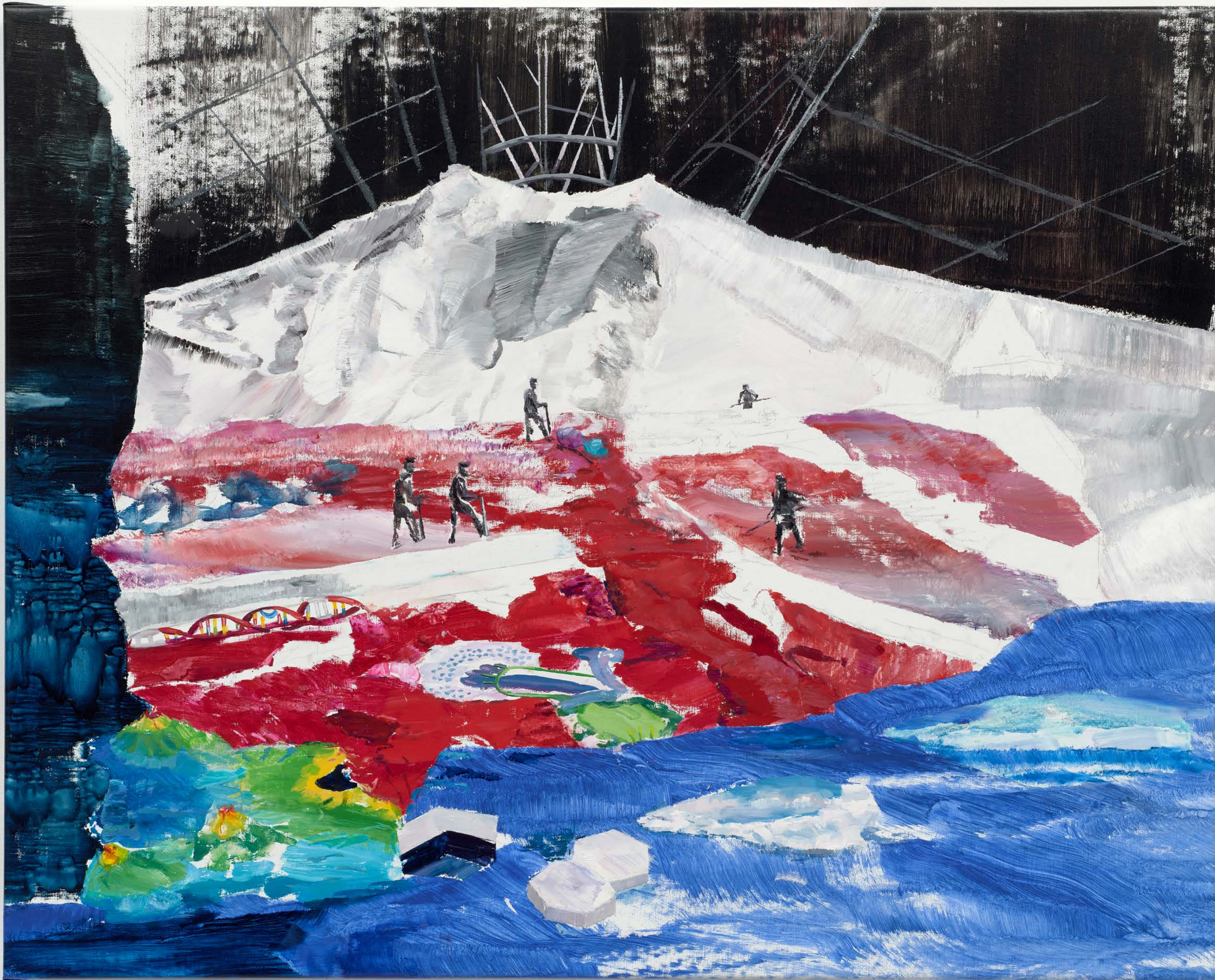
1956, 2026 oil on canvas 80 x 100 cm / 31,5 x 39,37 in.