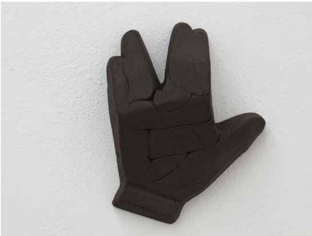
Stiff, 2018 Ceramica nera 21 x 17 x 6 cm. || 8,27 x 6,69 x 2,36 inches