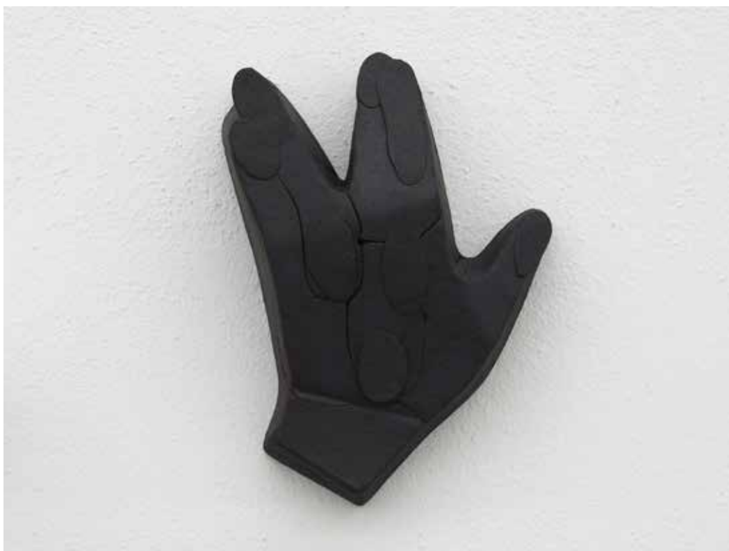
Stiff, 2018 Ceramica nera 19 x 14 x 6 cm. || 7,48 x 5,51 x 2,36 inches