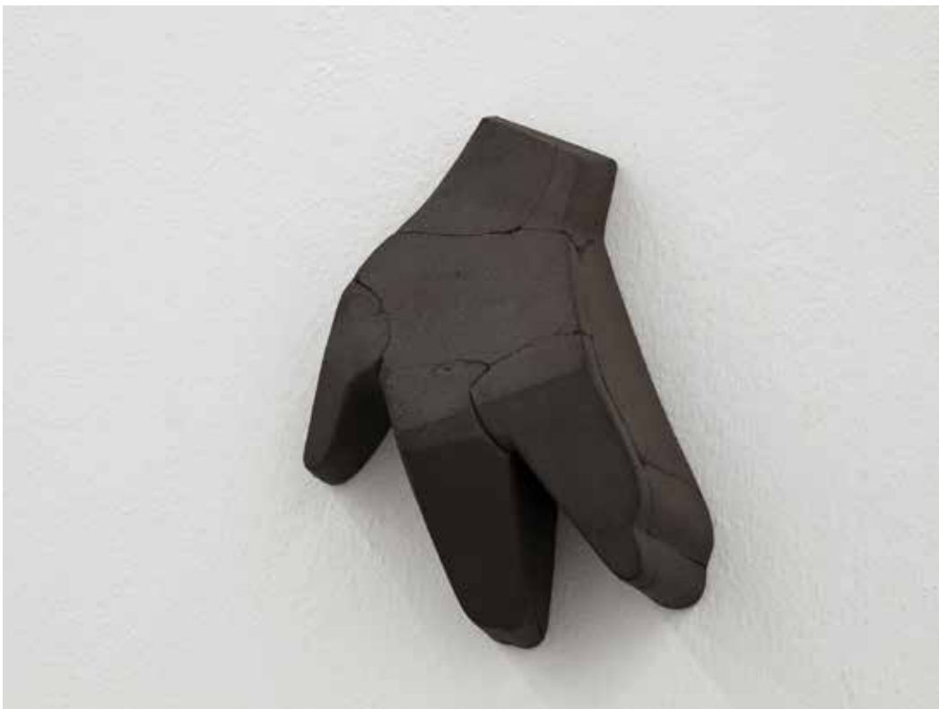
Stiff, 2018 Ceramica nera 19 x 15 x 6 cm. || 7,48 x 5,91 x 2,36 inches