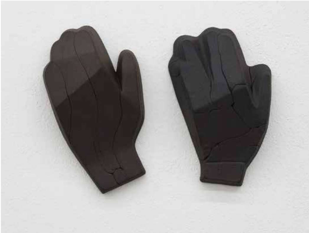
Stiff, 2018 - 2019 Ceramica nera 21 x 24 x 5 cm. || 8,27 x 9,45 x 1,97 inches