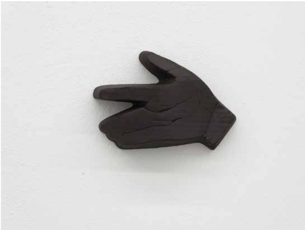
Stiff, 2018 Ceramica nera 18 x 12,5 x 5 cm. || 7,09 x 4,92 x 1,97 inches