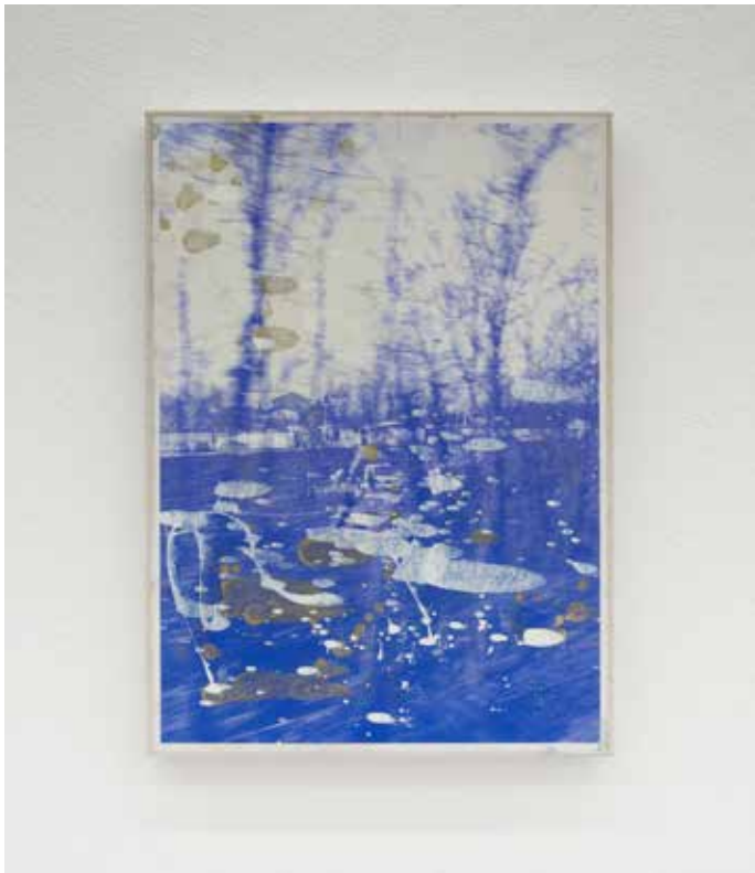
Paesaggio ciclico Variato #5, 2018 Smalti industriali su foto-copia 42 x 29,7 cm. || 16,54 x 11,69 inches