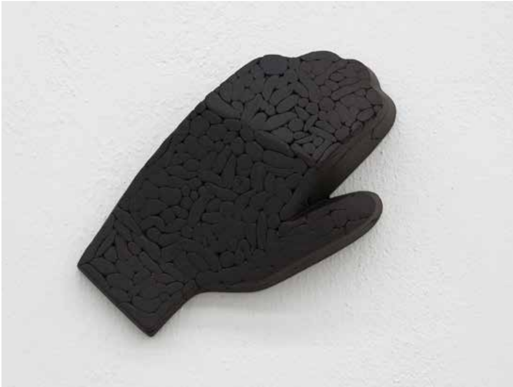
Stiff, 2018 Ceramica nera 20 x 17 x 5 cm. || 7,87 x 6,69 x 1,97 inches