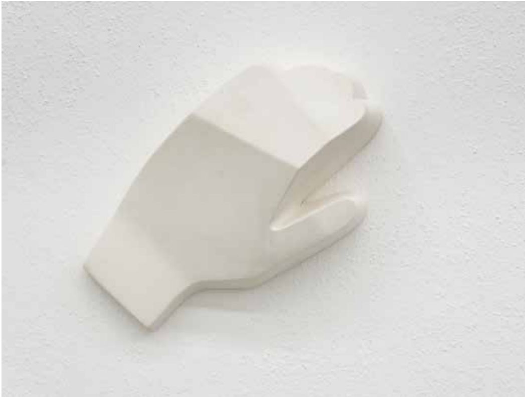
Stiff, 2018 Gesso e resina 20 x 18,5 x 5,5 cm. || 7,87 x 7,28 x 2,17 inches Edizione 1/3