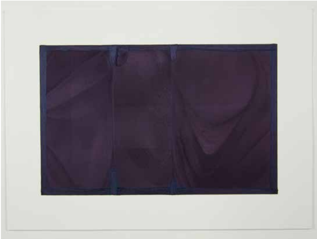
Abwesenheiten in preu- Bisch blau, 2013 Olio su carta 50 x 70 cm. || 19,69 x 27,56 inches