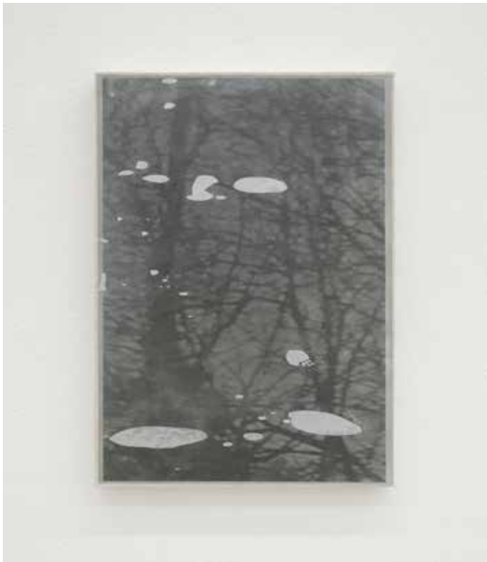
Paesaggio ciclico Variato #10, 2018 Smalti industriali su foto-copia 42 x 29,7 cm. || 16,54 x 11,69 inches