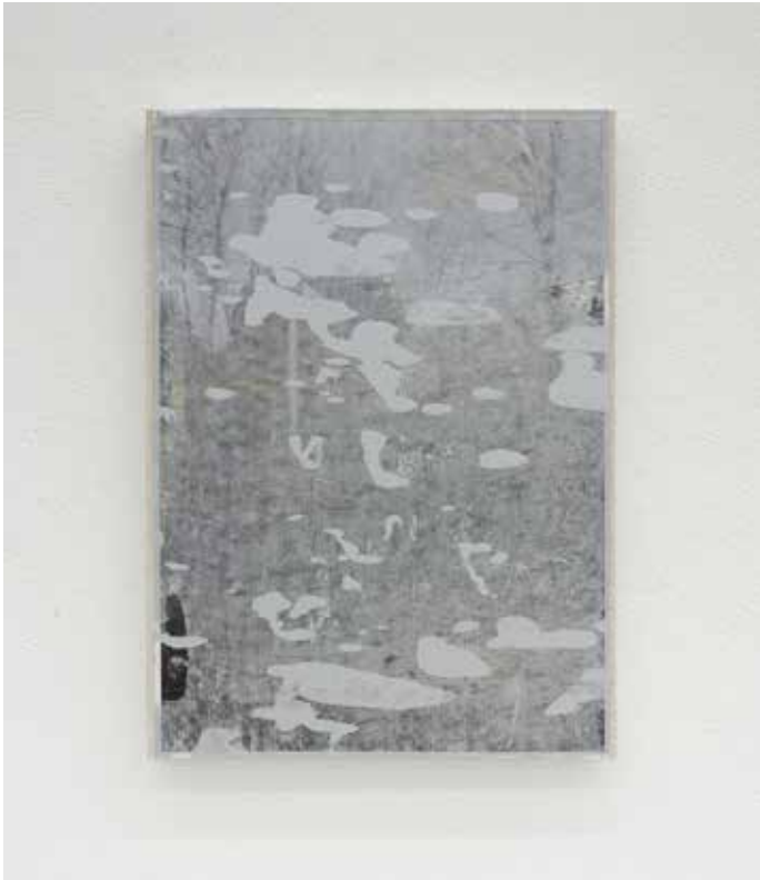
Paesaggio ciclico Variato #3, 2018 Smalti industriali su foto-copia 42 x 29,7 cm. || 16,54 x 11,69 inches