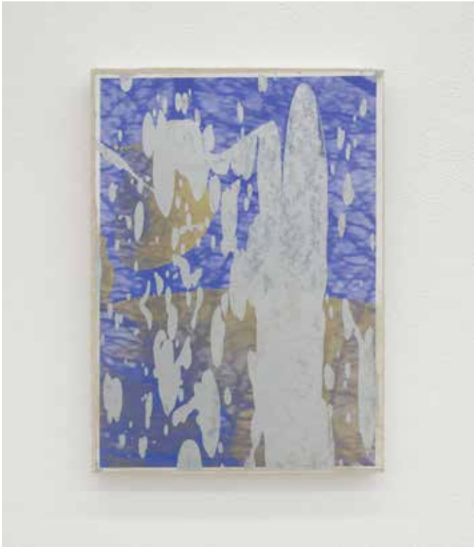
Paesaggio ciclico Variato #11, 2018 Smalti industriali su foto-copia 42 x 29,7 cm. || 16,54 x 11,69 inches