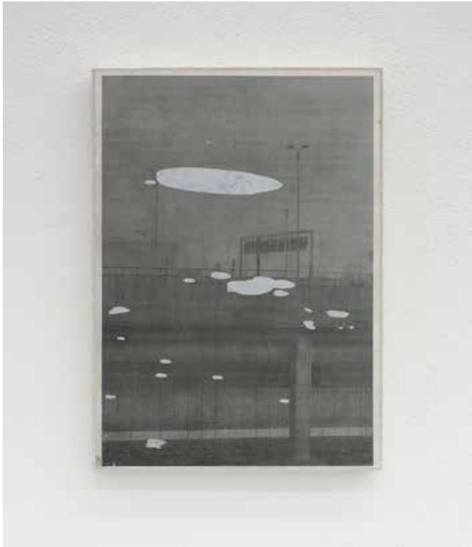
Paesaggio Ciclico Varia- to #1, 2018 Smalti industriali su foto-copia 42 x 29,7 cm. || 16,54 x 11,69 inches