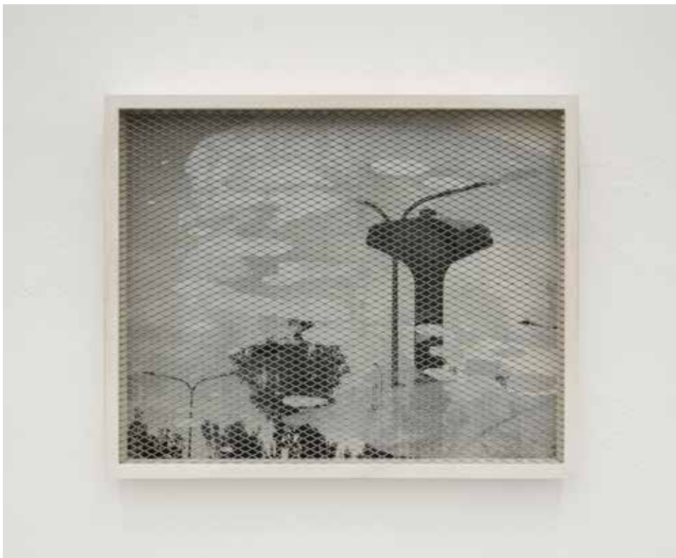
In-Grid #13, 2018 Smalti industriali su fo- to-copia, rete metallica, cornice 29,7 x 42 cm. || 11,69 x 16,54 inches