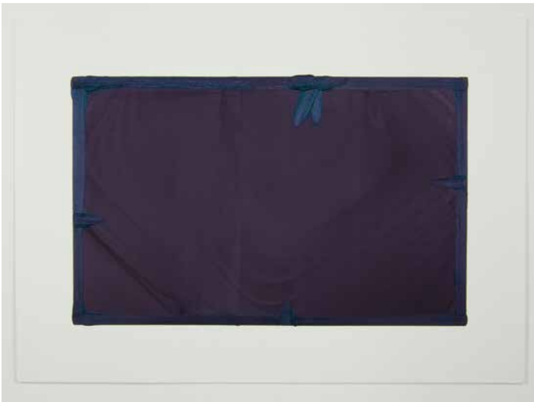
Abwesenheiten in preu- Bisch blau, 2013 Olio su carta 50 x 70 cm. || 19,69 x 27,56 inches