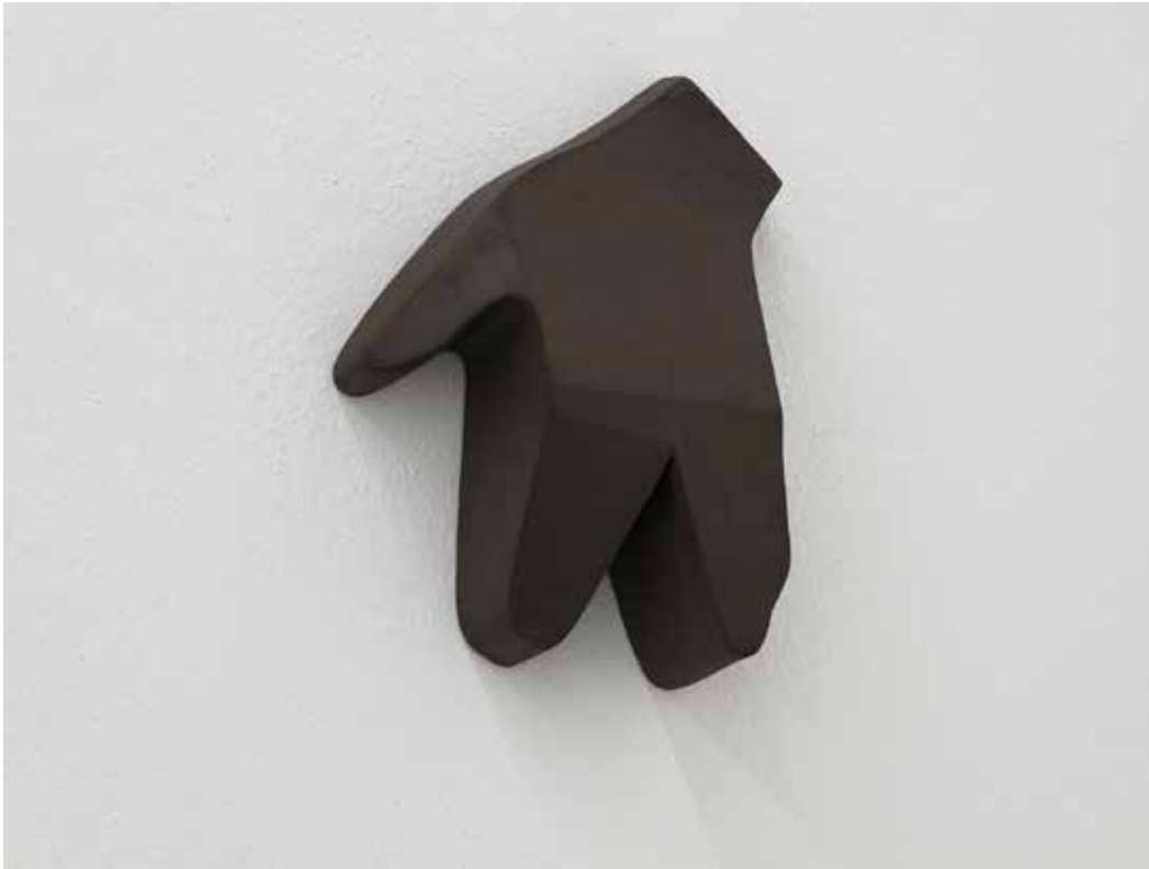
Stiff, 2018 Ceramica nera 19 x 14,5 x 6 cm. || 7,48 x 5,71 x 2,36 inches