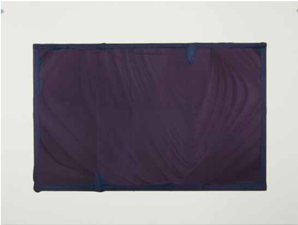
Abwesenheiten in preu- Bisch blau, 2013 Olio su carta 50 x 70 cm. || 19,69 x 27,56 inches