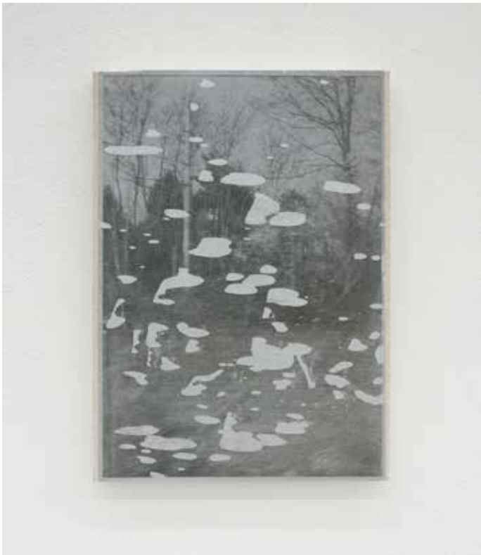
Paesaggio ciclico Variato #4, 2018 Smalti industriali su foto-copia 42 x 29,7 cm. || 16,54 x 11,69 inches