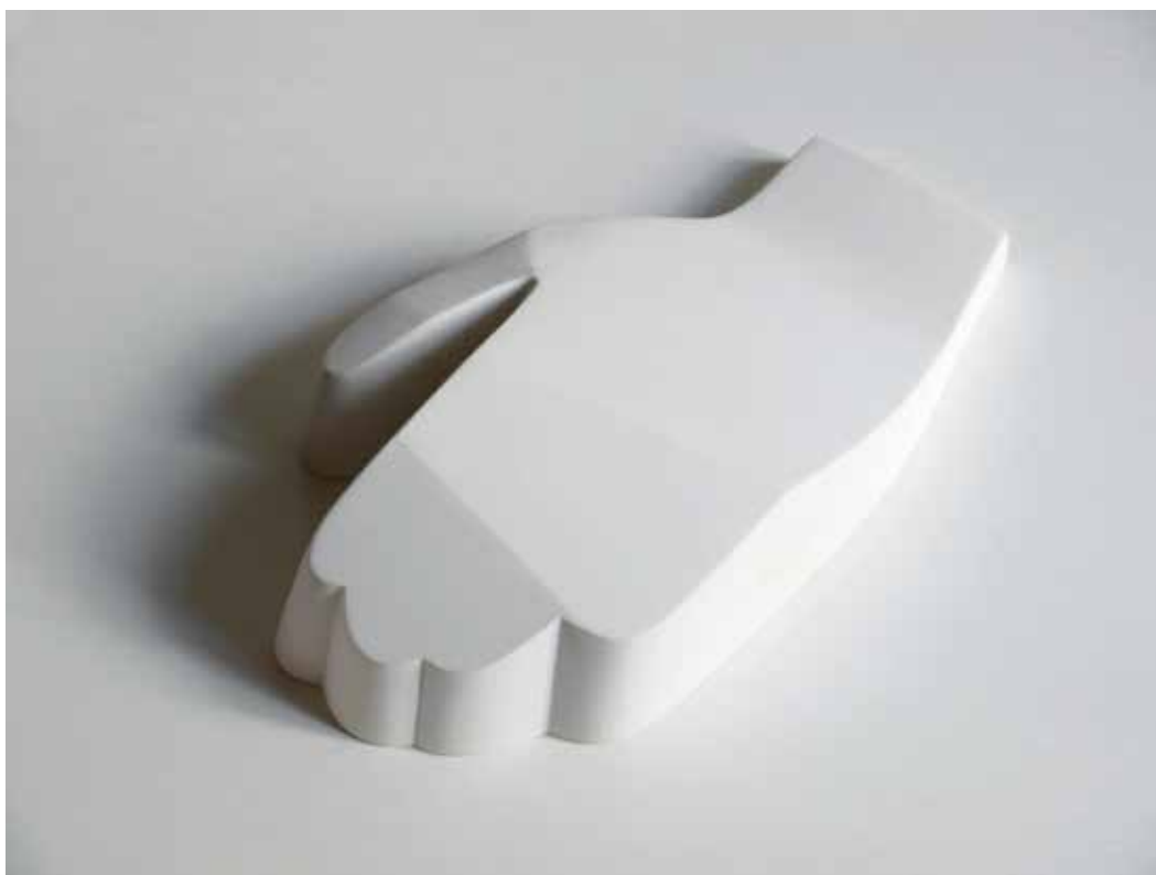
Italica, 2018 Gesso e resina 22 x 19 x 6,5 cm. || 8,66 x 7,48 x 2,56 inches Edizione 2/3