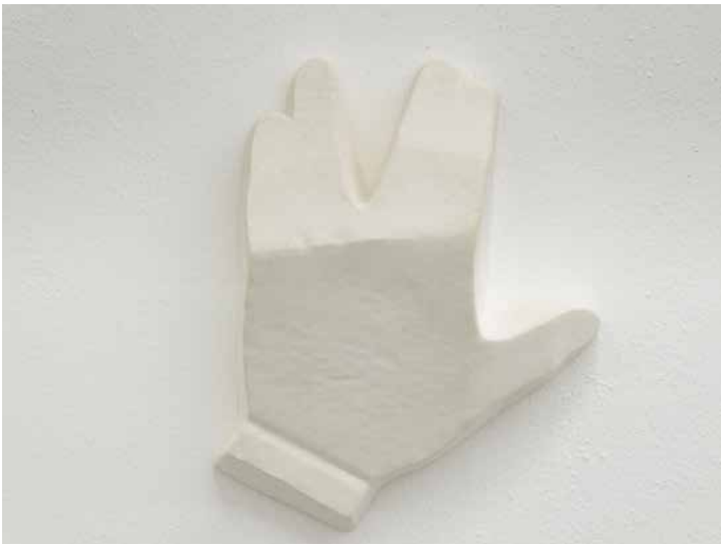
Stiff, 2018 Gesso e resina 23 x 18,5 x 6,5 cm. || 9,06 x 7,28 x 2,56 inches Edizione 1/3