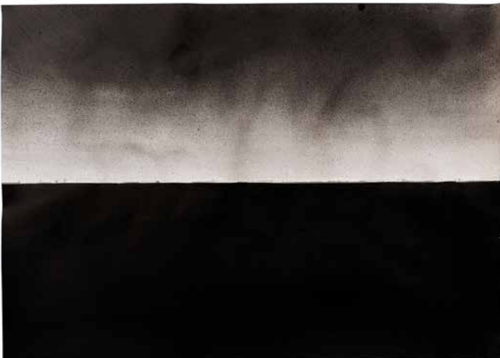
Mi disperdo e proseguo lasciandomi indietro un passo dopo l'altro, 2019 China su carta 100 x 140 cm. || 39,37 x 55,12 inches