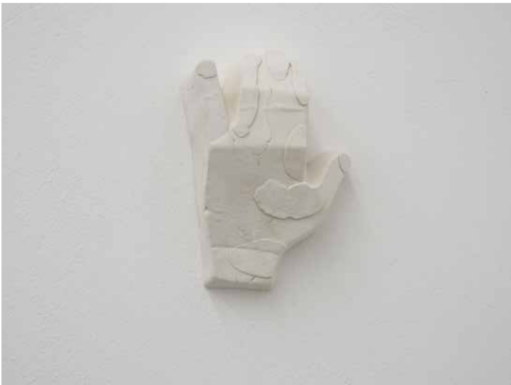
Stiff, 2018 Gesso e resina 20 x 14 x 7 cm. || 7,87 x 5,51 x 2,76 inches Edizione 1/3