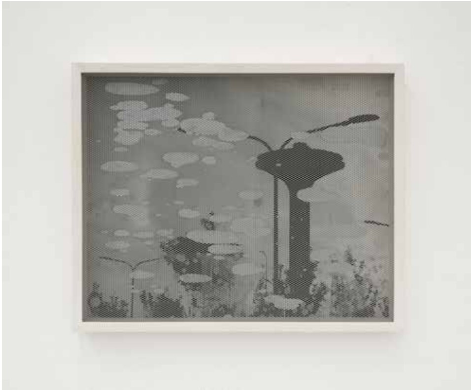
In-Grid #14, 2018 Smalti industriali su fo- to-copia, rete metallica, cornice 29,7 x 42 cm. || 11,69 x 16,54 inches