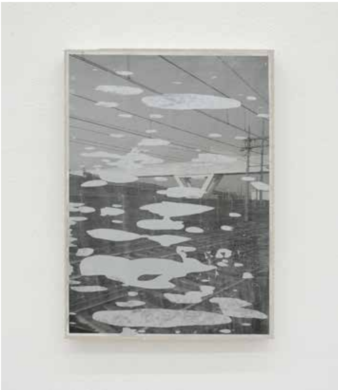
Paesaggio ciclico Variato #13, 2018 Smalti industriali su foto-copia 42 x 29,7 cm. || 16,54 x 11,69 inches