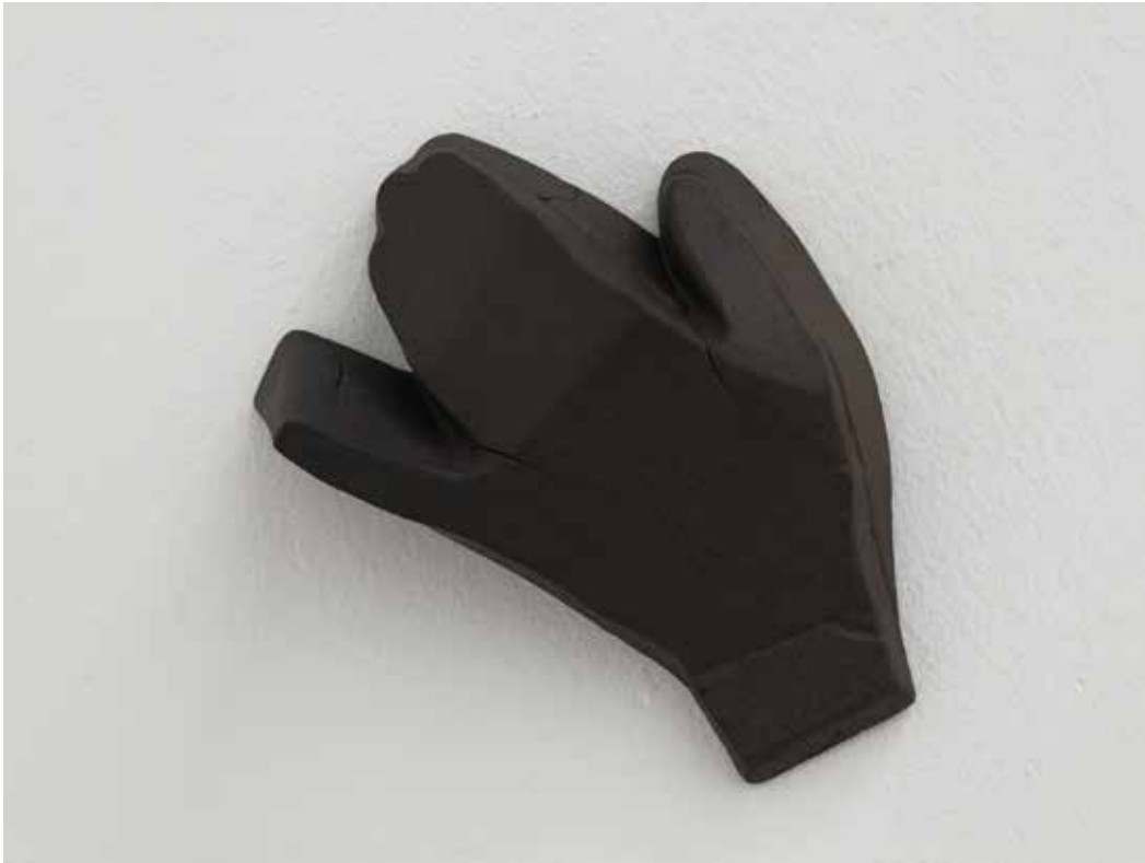
Stiff, 2019 Ceramica nera 17 x 17 x 6,5 cm. || 6,69 x 6,69 x 2,56 inches