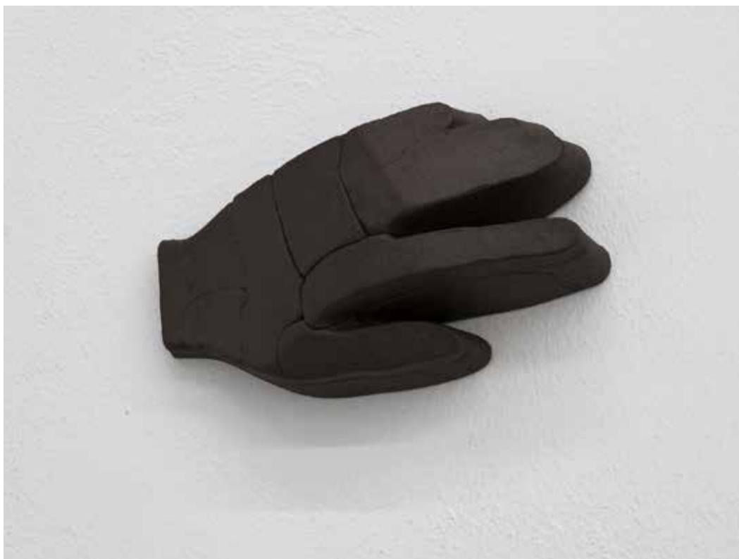
Stiff, 2019 Ceramica nera 19 x 11,5 x 6 cm. || 7,48 x 4,53 x 2,36 inches