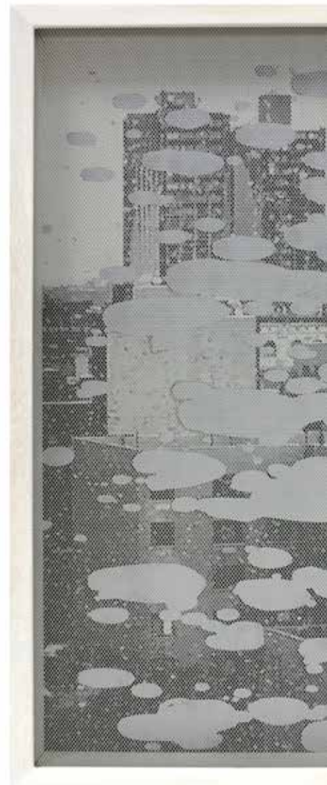
In-Grid #9 #10 #11, 2018 Smalti industriali su foto-copia, rete metallica, cornice 29,7 x 42 cm. || 11,69 x 16,54 inches