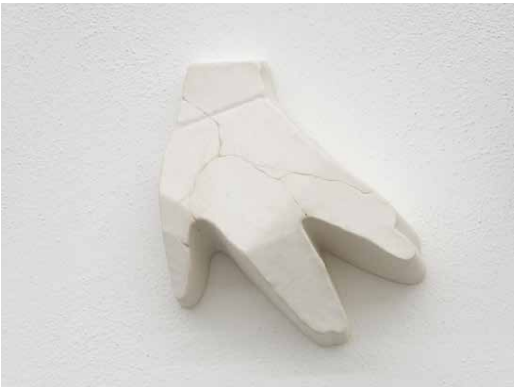
Stiff, 2018 Gesso e resina 19 x 17 x 7 cm. || 7,48 x 6,69 x 2,76 inches Edizione 1/3