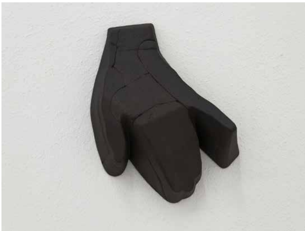
Stiff, 2019 Ceramica nera 19 x 15,5 x 7 cm. || 7,48 x 6,1 x 2,76 inches