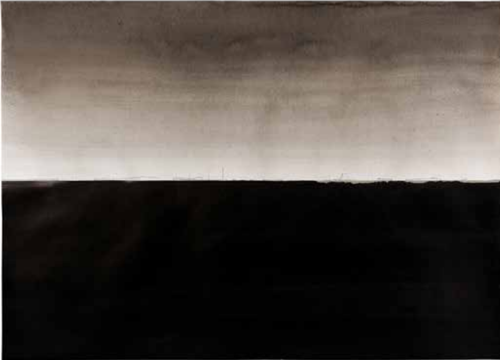
Mi disperdo e proseguo lasciandomi indietro un passo dopo l'altro, 2019 China su carta 100 x 140 cm. || 39,37 x 55,12 inches