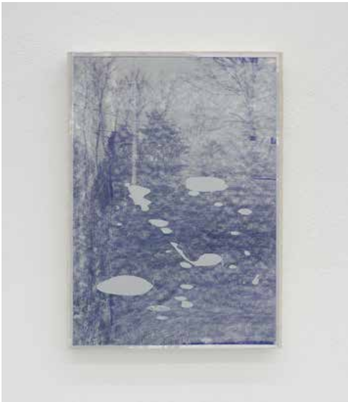
Paesaggio ciclico Variato #2, 2018 Smalti industriali su foto-copia 42 x 29,7 cm. || 16,54 x 11,69 inches