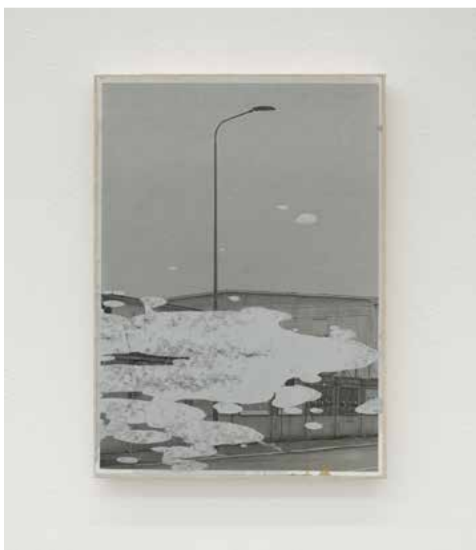
Paesaggio ciclico Variato #9, 2018 Smalti industriali su foto-copia 42 x 29,7 cm. || 16,54 x 11,69 inches