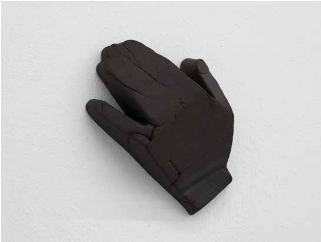
Stiff, 2018 Ceramica nera 18,5 x 17 x 5 cm. || 7,28 x 6,69 x 1,97 inches