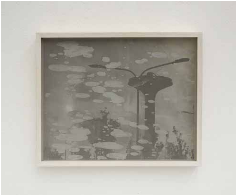
In-Grid #12, 2018 Smalti industriali su fo- to-copia, rete metallica, cornice 29,7 x 42 cm. || 11,69 x 16,54 inches