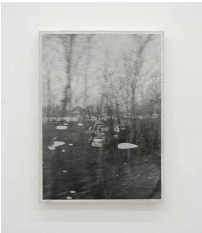
Paesaggio ciclico Variato #6, 2018 Smalti industriali su foto-copia 42 x 29,7 cm. || 16,54 x 11,69 inches